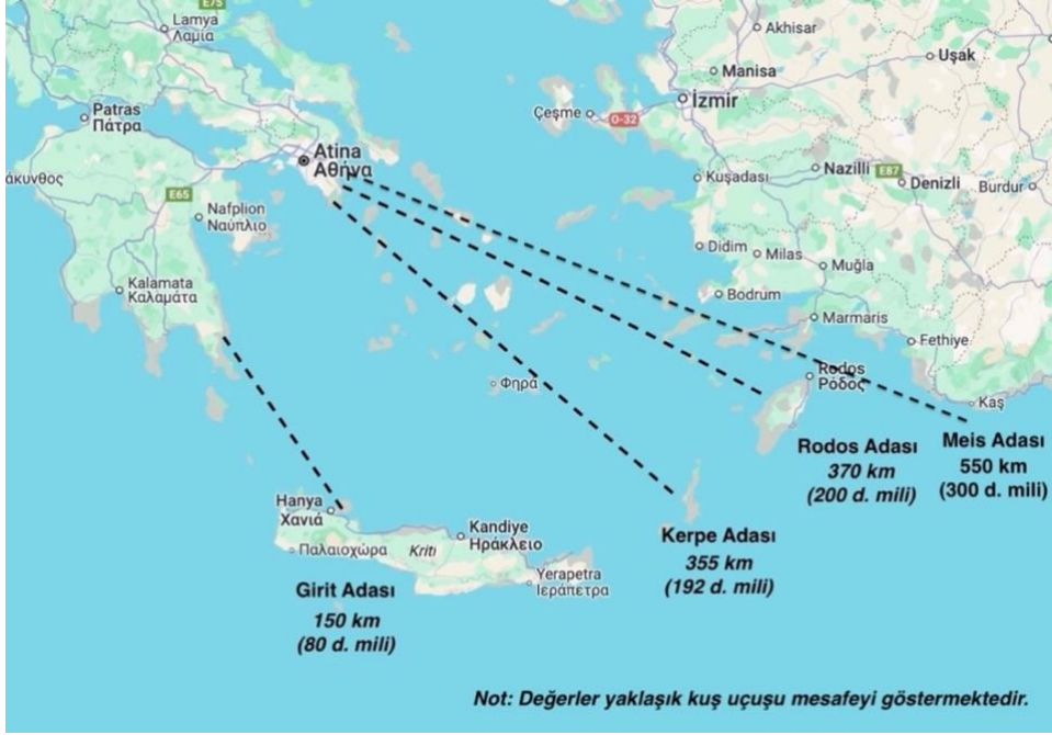
Şekil 3: Önemli Yunan Adaları'nın Bölgeye Olan Yaklaşık Uzaklıkları