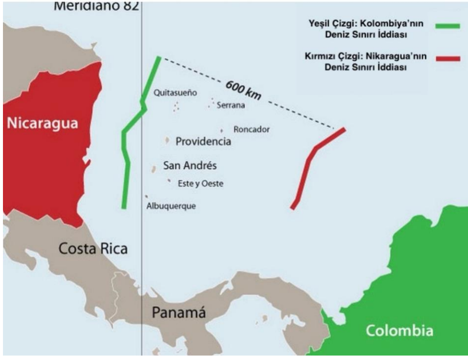
Şekil 4: Nikaragua-Kolombiya Deniz Sınırı Haritası