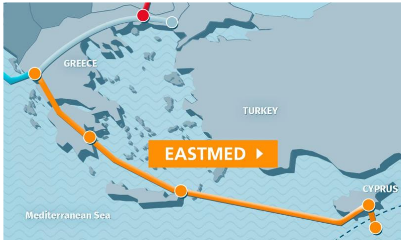
Şekil 1. Planlanan EastMed Projesi Rotası

Bölgedeki doğalgaz rezervlerini devletlerin yıllık kullanımlarına oranlamak gerekirse, rezervler yaklaşık olarak Türkiye'nin 572 yıllık potansiyel kullanımını, Avrupa'nın ise 30 yıllık kullanımını karşılayacak düzeydedir (Yaycı, 2012). Bu denli büyük bir doğalgaz rezervinden pay almak, yalnızca bu kaynakların getirilerine sahip olmakla sınırlı kalmayacak; rezervlerin araştırılması, çıkarılması, işlenmesi, işletilmesi ve taşınması gibi birçok sektörün iş birliği içinde çalışmasını gerektirecek ve kıyı devletine büyük bir ekonomik fayda sağlayacaktır (Özgen 2013; Yaycı, 2020a).