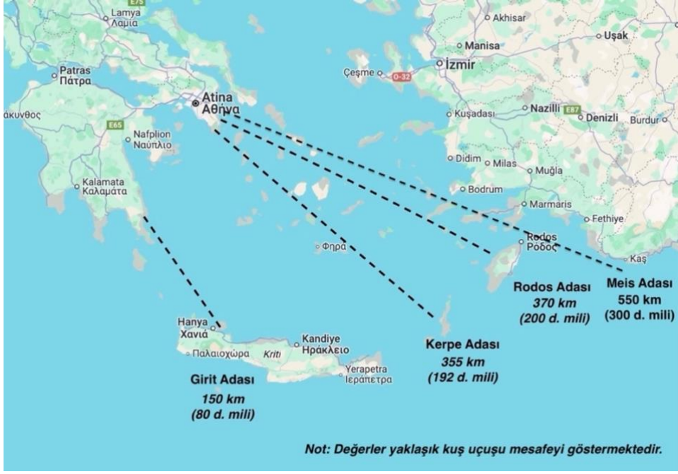
Şekil 3: Önemli Yunan Adaları'nın Bölgeye Olan Yaklaşık Uzaklıkları